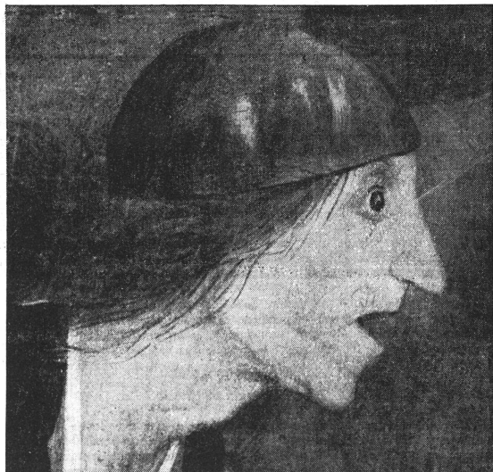
... cette « Margot l'Enragée » de Bruegel (détail)