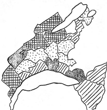
Proportion des femmes exerçant une profession

Il existe une relation certaine entre l'importance de la population féminine professionnelle active et la façon dont la femme est acceptée dans la vie politique