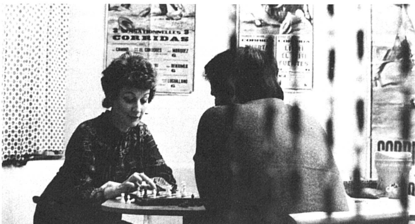
Echecs: Femmes Suisses est toute contente d'annoncer la naissance du « Centre d'échecs féminin ». Local: Brasserie de la Fontenette, 33 route de Veyrier à Carouge.