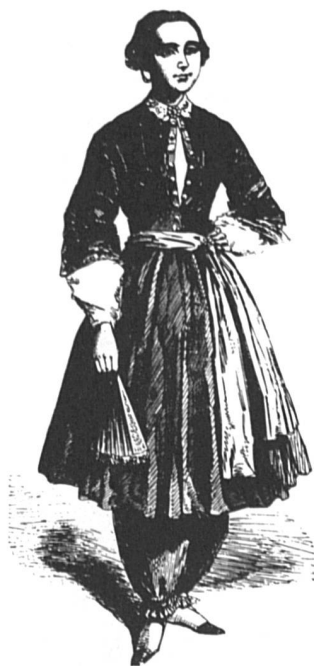
Amelia Bloomer et son costume.