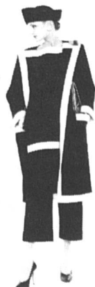
Modèle Nina Ricci

On va finir par croire qu'on s'est donné le mot!