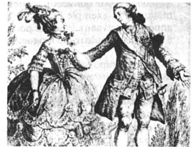
Gravure anonyme de 1788 B.N.