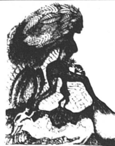
La femme au feuillage (42 x 61)