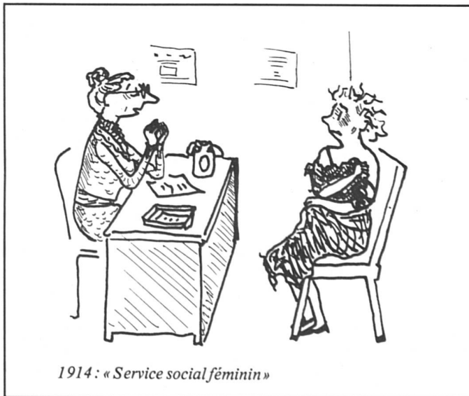
1914 : « Service social féminin »

Bon, puisque cette question n'a l'air d'intéresser personne sauf moi, on passe aux salaires. Faut-il faire une différence ? « L'égalité des salaires ne pose pas de problèmes très aigus car le travail n'est pas le même. Les hommes font des patrouilles de