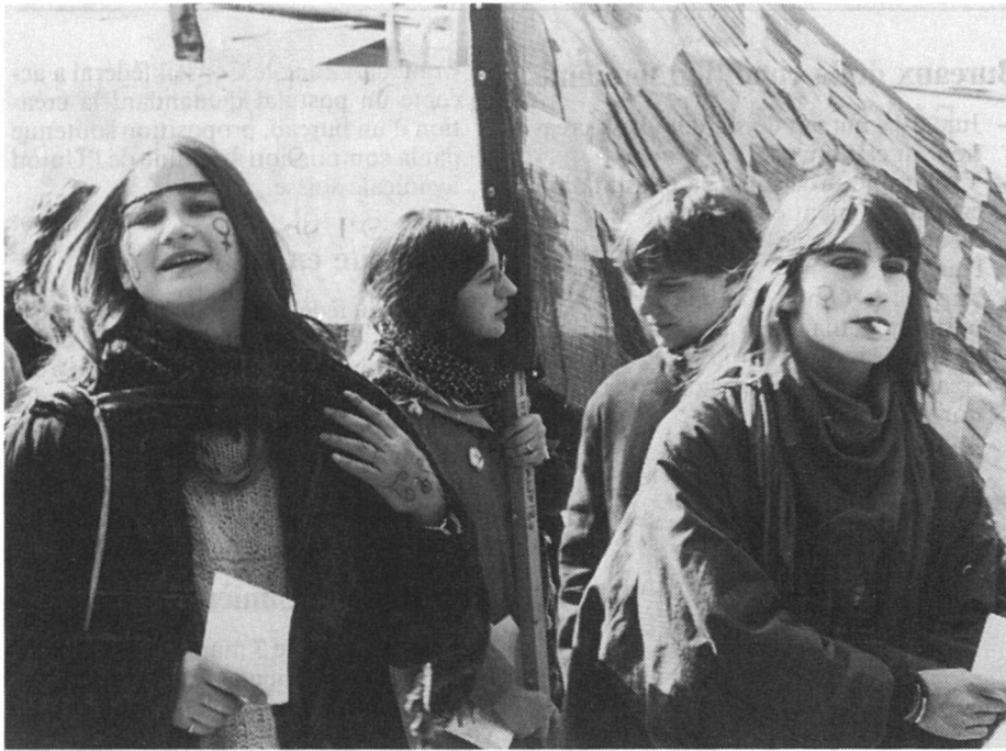
A Lausanne le 6 mars