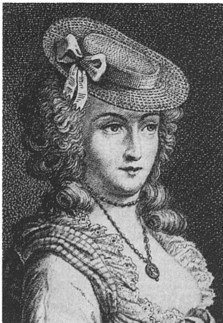
Mme d'Épinay, gravure anonyme

Les Emilie ne se sont jamais rencontrées. Elles appartenaient à des milieux qui ne se fréquentaient pas : Mme du Châtelet à la haute noblesse, Mme d'Épinay à la petite. Pourtant, le dernier amant de la première a été l'un des premiers de la seconde, et au