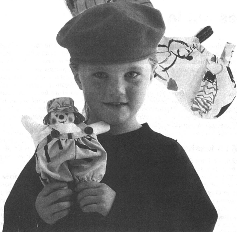
Un bricolage de « 100 idées »