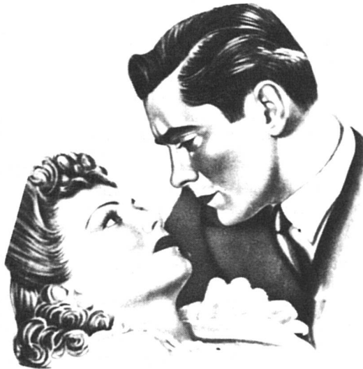
... le prince charmant...