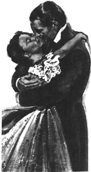
Les modes changent...