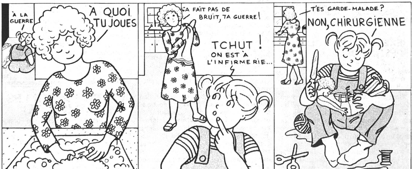
La Gazette des Femmes, octobre 1980.

Ainsi l'application de l'égalité au niveau du quotidien et des lois se met en route. Souhaitons à cette première commission un bon démarrage. — (jbw)