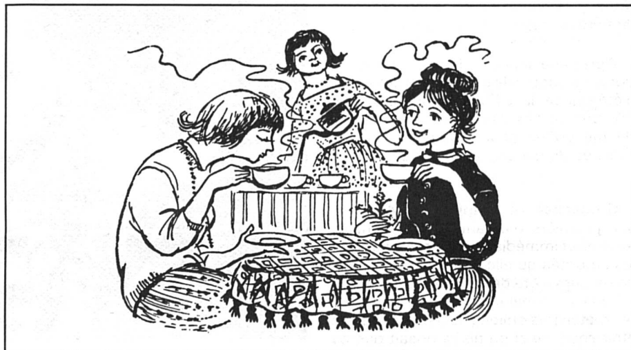
D'après le T.F., en Suisse, encore aujourd'hui les femmes papotent au tea-room tandis que les hommes vont au charbon...

En Appenzell RE, la question du droit de vote des femmes a connu, fin août, des développements dont, pour des raisons de délais, nous ne pourrions vous informer que dans le prochain numéro. Dans les RI également, quelques partisans persévérants essaient cette fois de proposer qu'on donne aux femmes le droit de vote et d'éligibilité au plan communal — que les femmes possèdent déjà