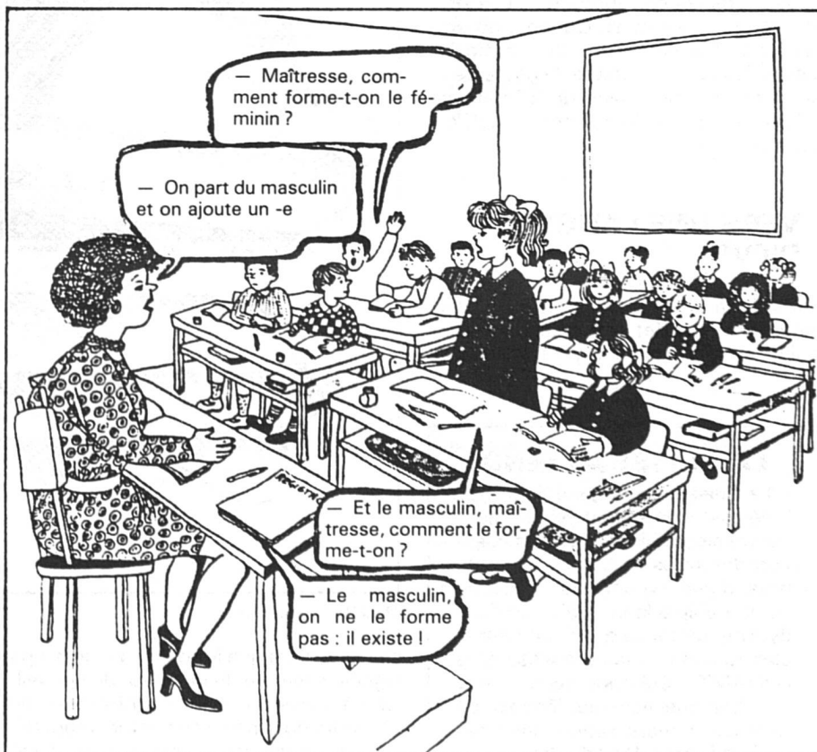
Dessin tiré de « Croce Rossa Svizzera »