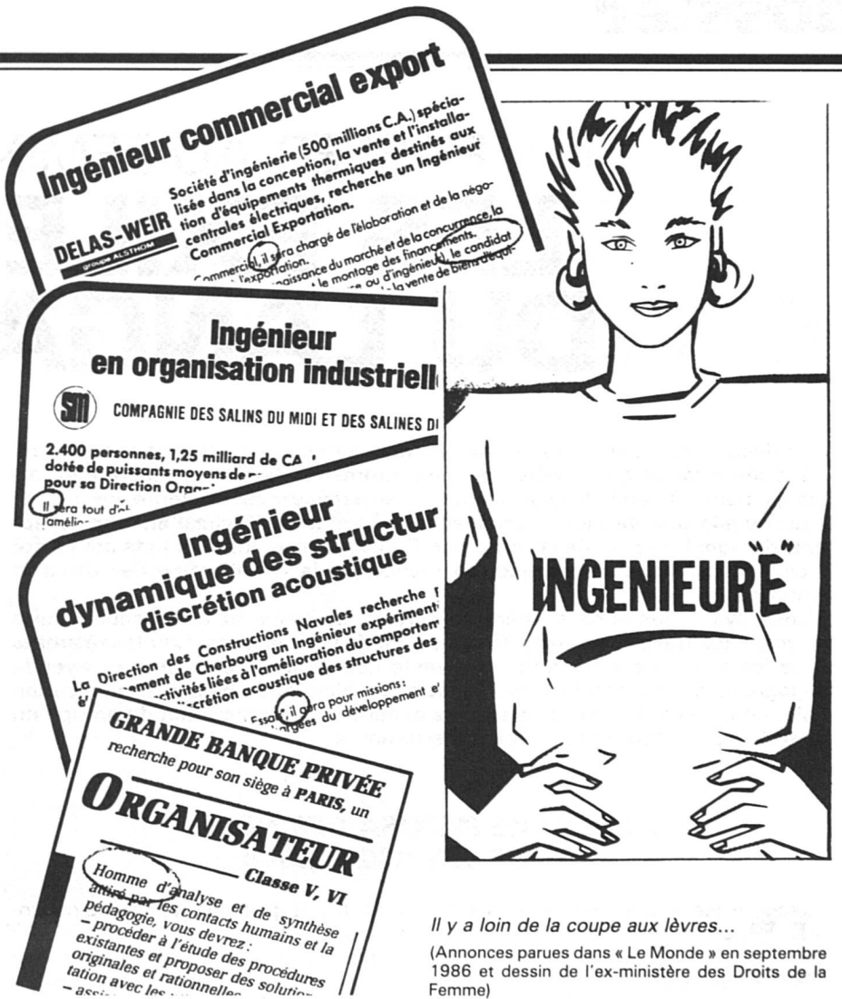
Il y a loin de la coupe aux lèvres... (Annonces parues dans « Le Monde » en septembre 1986 et dessin de l'ex-ministère des Droits de la Femme)

sexuelle. Toute langue doit donc s'adapter aux réalités nouvelles. L'accession des femmes de plus en plus nombreuses à des fonctions de plus en plus diverses est une de ces réalités qui doit trouver sa traduction dans le vocabulaire » (compte rendu final). C'est ainsi qu'on devra désormais dire : « une peintre, une chimiste, une huissière, une technicienne en bâtiment, une assistante, une agente, une sergente, une footballeuse, une coureuse à pied, une chef, une enquêtrice », mais aussi : « une professeur » (avec ou sans e), « une auteur-e » (il serait plus juste de dire « autrice », puisque « auteur » et « acteur » sont un même mot jusqu'au XVIIe siècle) (voir p. 12). Celles et ceux qui trouvent « écrivaine » affreux et rimant avec « vaine » (pourquoi pas « veine » ?) se souviendront de « châtelaine, souveraine ». On objecte aussi que les femmes, surtout lorsqu'elles sont minoritaires dans leur profession, refusent une féminisation qui les dévalorise. Ainsi, l'enquête faite en France a montré que 80 % des femmes diplômées en pharmacie veulent se faire appeler « Mme le pharmacien ». Personne ne peut les obliger à être pharmaciennes, mais quelle enseignante voudrait être « instituteur-femme » ? Rappelons aussi que ce sont