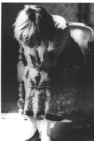
Désormais, le mal est fait.

Les enseignants de Sainte-Jeanne-Antide ripostent : les élèves mis en échec (filles et garçons) sont, pour la très grande majorité, domiciliés à Martigny même : il ne s'agirait donc pas d'un problème de mixité mais de disparité entre la ville et les autres communes du district. Dès lors, de deux