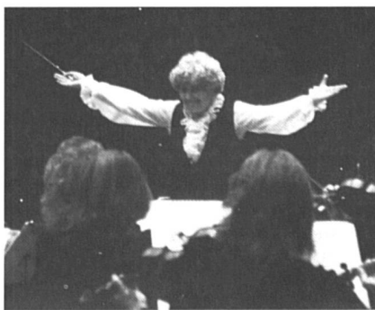
Photo du film « Les femmes chefs d'orchestre », de Christine Olofson .

Dès les premières images du film, on travaille, on peine, on s'essouffle, on s'identifie à la passion de ces six femmes (américaines, suédoises, norvégienne et