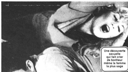
Une découverte sexuelle qui fait crier de bonheur même la femme la plus sage

Il m'a aussi expliqué ce qu'il fallait faire pour qu'une femme jouisse vraiment (ce qui s'appelle jouir). C'est