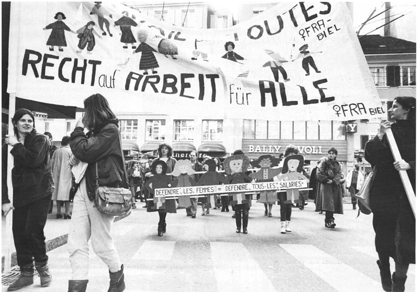
Droit au travail pour toutes... mais quel travail ?