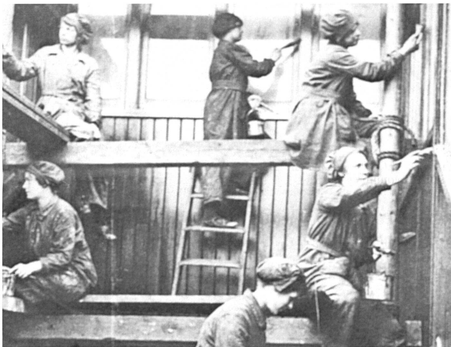
Pendant la Première Guerre mondiale, des centaines d'Anglaises exercèrent des métiers masculins, recevant (temporairement) des salaires d'hommes. Ici, femmes peintres en bâtiment.

Voici, enfin, tout ce que vous avez toujours voulu savoir sur la situation des femmes ménagères et salariées à Genève. Mais attention, tout ce qui brille n'est pas de l'or!