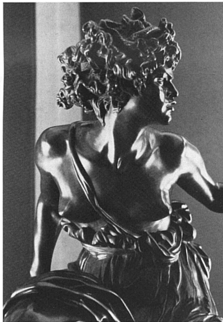
La Pythie, 1870.