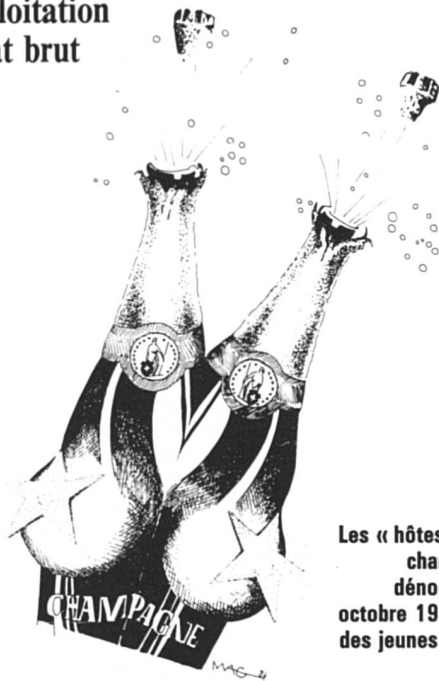
Les « hôtesse » des bars à champagne, dont FS dénonçait les abus en octobre 1984, sont souvent des jeunes femmes du tiers monde.

(pbs) — Un groupe interdépartemental vient d'examiner l'ensemble de la question de l'exploitation des femmes du tiers monde en Suisse, y compris l'aspect pénal: prostitution, tourisme sexuel, agences matrimoniales spécialisées, conditions de travail des danseuses, etc. Ce groupe, présidé par Renate Schwob de l'Office de la justice du Département fédéral de justice et police souligne dans son rapport qu'actuellement la législation ne permet que dans une très modeste mesure d'apporter des correctifs à la misère matérielle et aux injustices dont ces femmes sont victimes. Mais les divers départements de l'administration vont préparer des propositions concrètes pour remédier à cette situation. Par exemple, en révisant les articles du code pénal sur les délits sexuels, la loi sur l'emploi, les dispositions sur les assurances sociales pour les engagements de courte durée et sur l'indemnisation des victimes d'actes de violence, etc. Les cantons seront rendus attentifs à leurs obligations et à leurs possibilités d'action avec les règlements d'application.