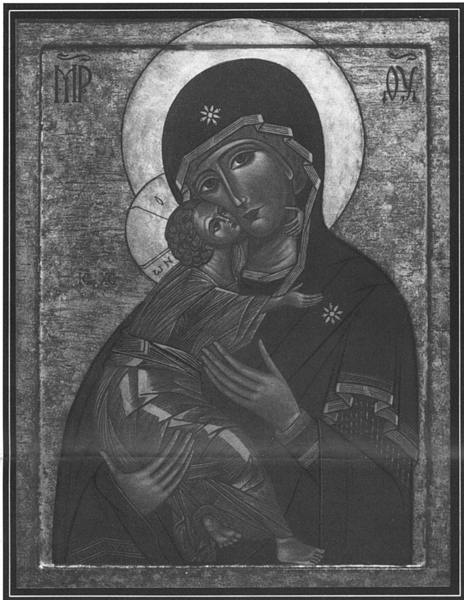
Icône de Notre-Dame de Wladimir, couvent des bénédictines du Mont des Oliviers à Jérusalem : Marie, la maman de Jésus...

* Julienne de Norwich, théologienne anglaise du Moyen Âge, l'une des mères de la théologie féministe.