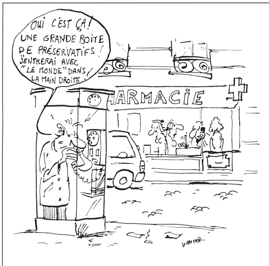
L'exemple des adultes: il y a les coincés... (Dessin tiré de l'ouvrage «L'Amour préservé»)

Tremplin assure l'accueil et l'hébergement de jeunes toxicomanes; 20% d'entre eux sont séropositifs et les animateurs sont