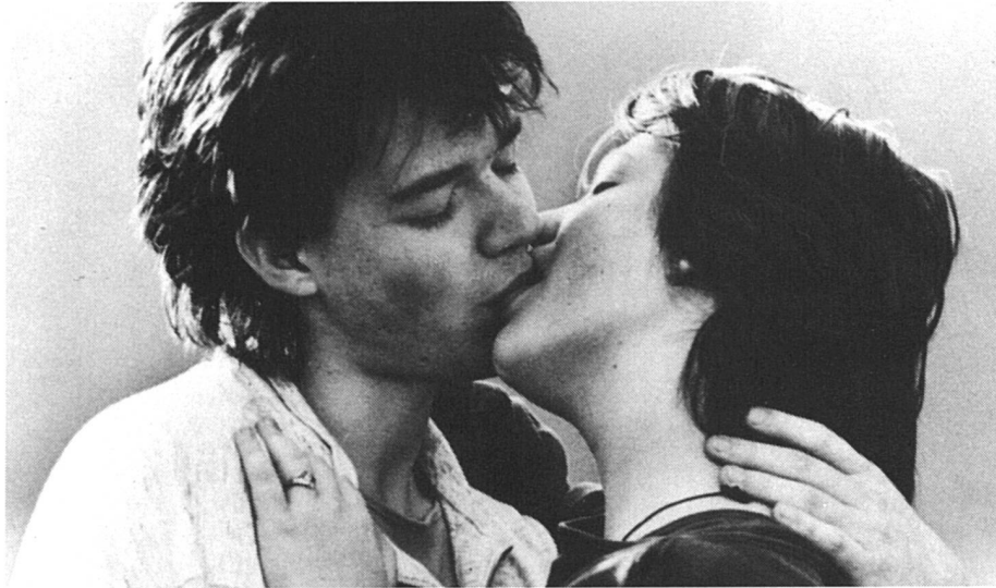
Le sida a-t-il tué l'amour?