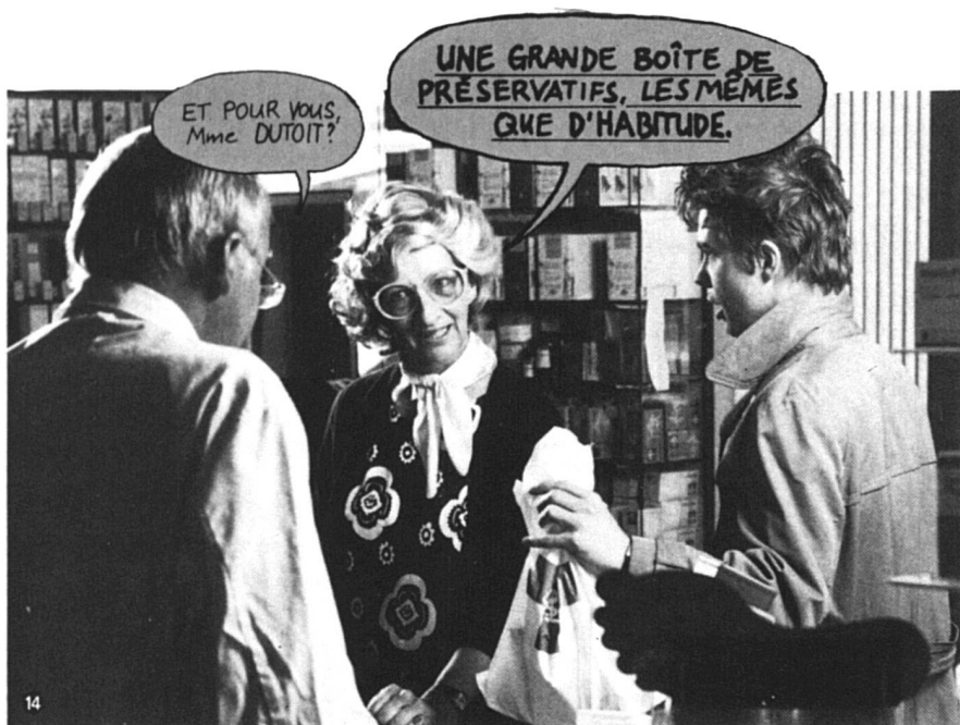
... et les complètement relax ! (Tiré d'un roman-photo paru dans un numéro spécial pour les jeunes de PS Magazine, publication de l'OFSP)

observe également l'inconséquence de certains comportements comme celui d'un jeune paniqué par son premier rapport homosexuel mais qui ne se soucie pas des risques encourus en couchant avec des filles.