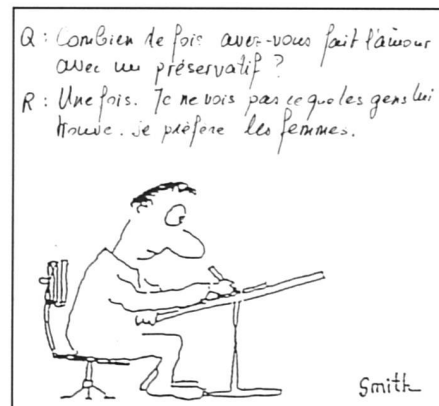
Les courts-circuits de l'information... (Dessin tiré de l'ouvrage «L'Amour préservé»)

Dans les grandes lignes, le Service santé jeunesse suit les directives de l'OFSP et distribue le matériel didactique de l'office fédéral agréé d'initiatives genevoises: dossiers, textes d'adolescents ou expositions.