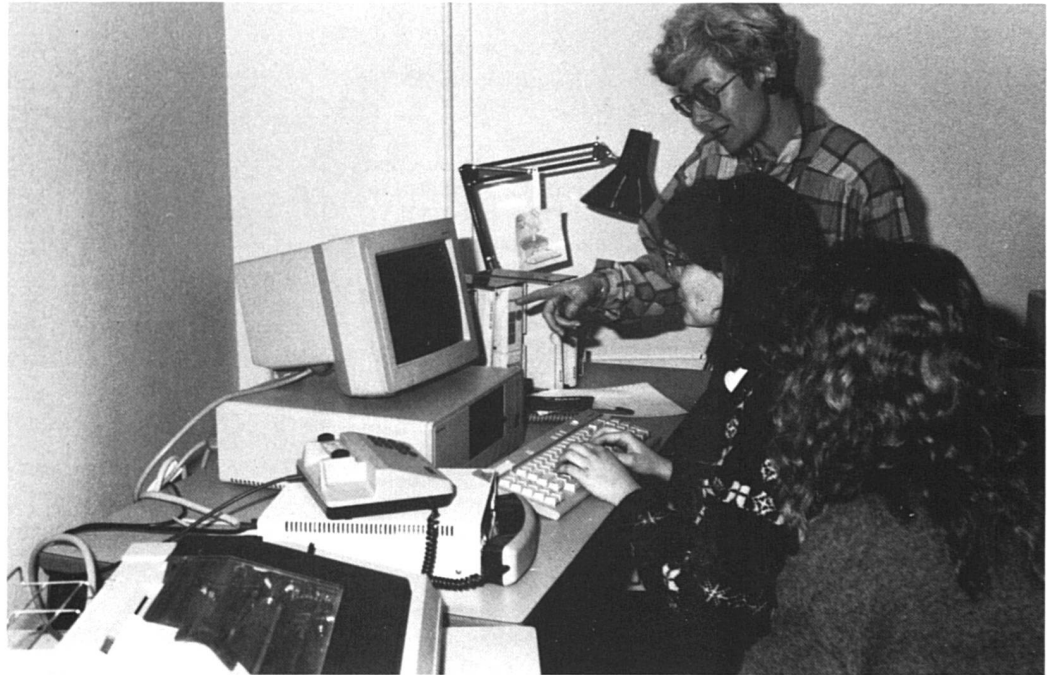
Maîtriser les nouvelles technologies.

La fonction première des bibliothécaires devient ainsi celle de médiateur entre les documents et les besoins des usagers. Dans le nouveau plan d'études, des cours de commu-