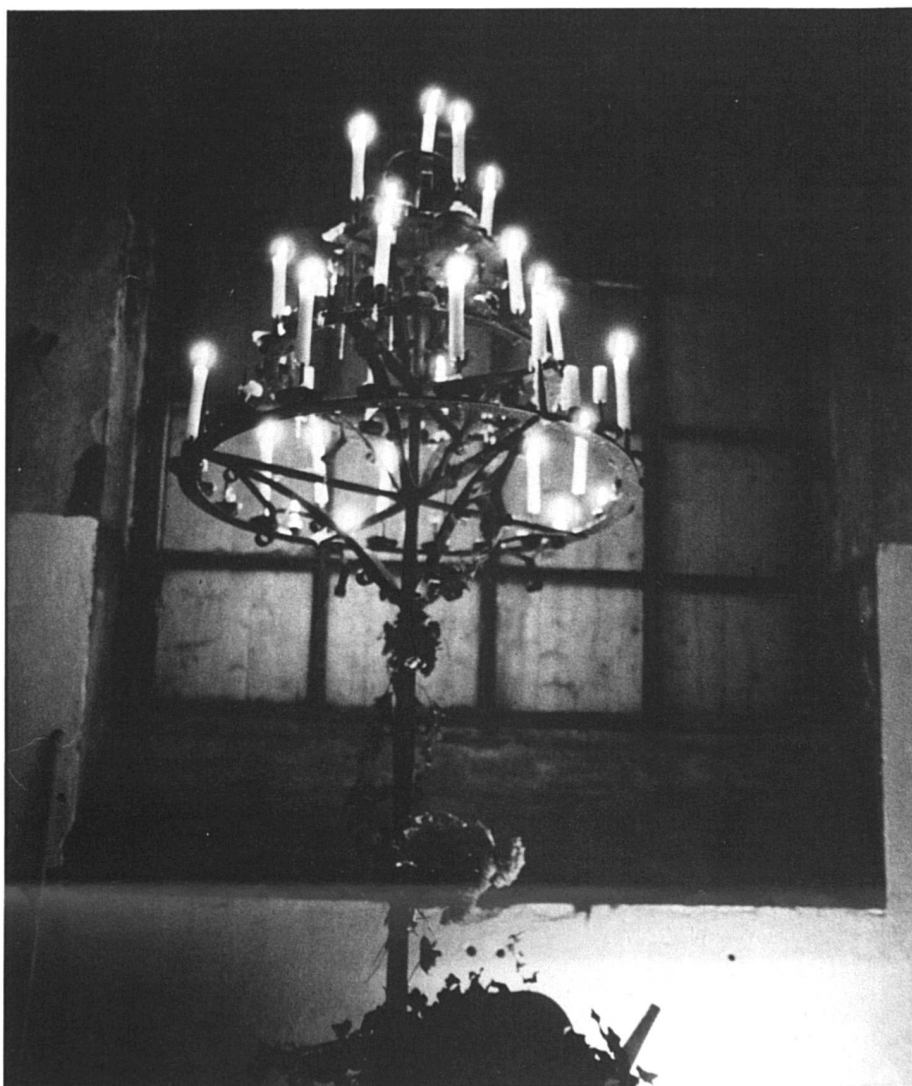
Pour éclairer notre lanterne...