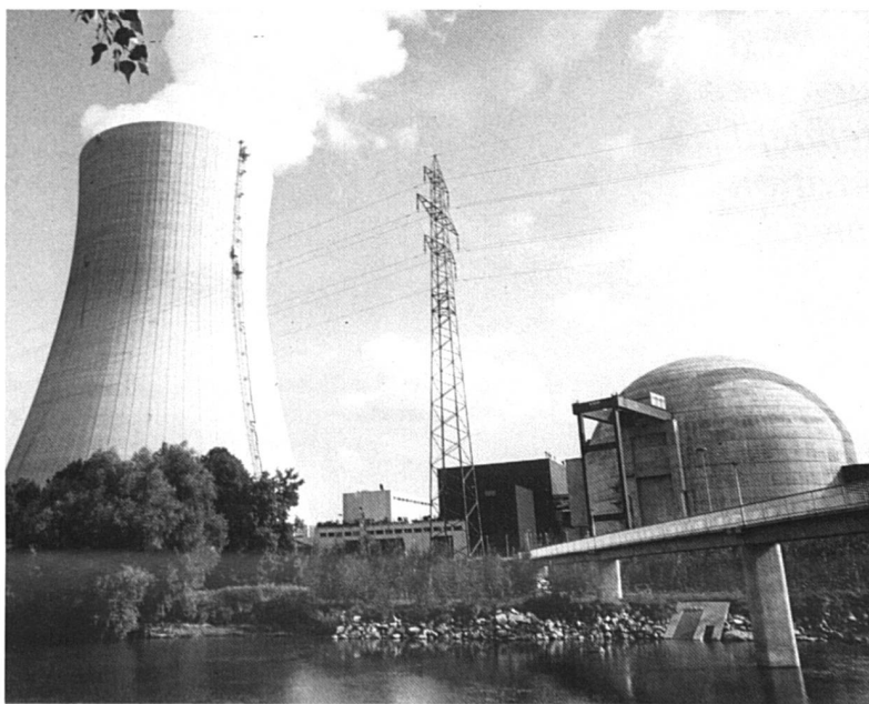
La centrale de Gösgen.

D'un côté, une confiance dans le progrès que résumait à merveille les propos tenus par la philosophe (eh oui, encore une! mais aussi le sujet est éminemment philosophique) Jeanne Hersch après l'accident de Tchernobyl: «Il faut retrouver la dignité humaine, réfléchir et retrouver le sens de la mesure et de l'Histoire, dans le vrai sens du terme, et non retourner dans la caverne de nos ancêtres... Grâce au développement industriel, l'homme peut non seulement vivre plus agréablement – ce qui est déjà beaucoup – mais il peut aussi se développer, consacrer davantage de temps aux études, avoir accès à toutes les formes de la culture, jouir de temps libre, penser à autre chose qu'aux soucis quotidiens de la survie... Si l'énergie, y compris l'énergie nucléaire, est effectivement utilisée à donner à davantage d'êtres humains plus de chances d'accéder à une liberté respon-