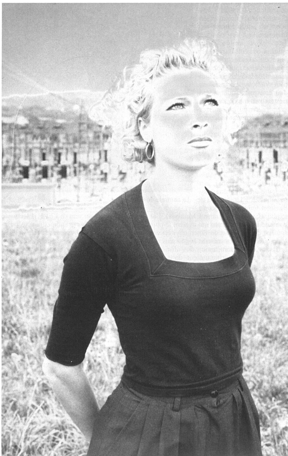
Les femmes et l'énergie : un débat de fond.