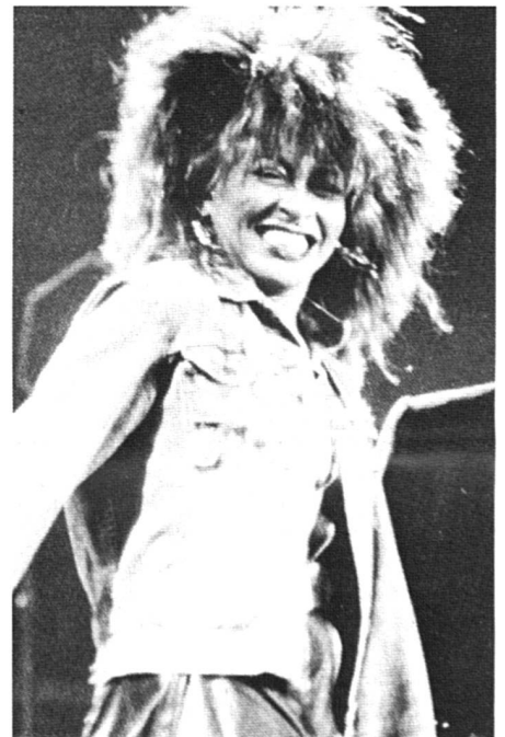
Tina Turner, ou la cinquantaine réussie!