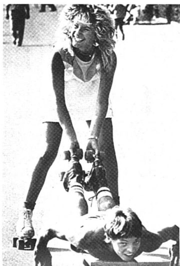
Etre bien dans sa peau...

(ib) – Répondant à l'appel du Centre de liaison, les Neuchâteloises des diverses sociétés et associations se réunissent traditionnellement une fois l'an. Le