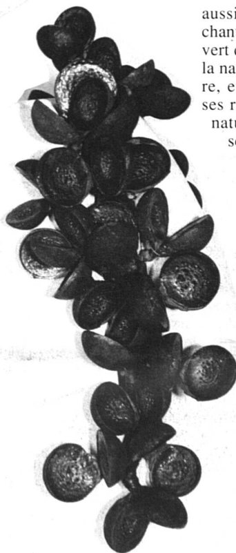
Sculpture: Siporex, éléments végétaux (Australie), 65cm x 45cm.