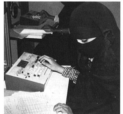
Employée de la poste centrale de Saona, au Yémen.