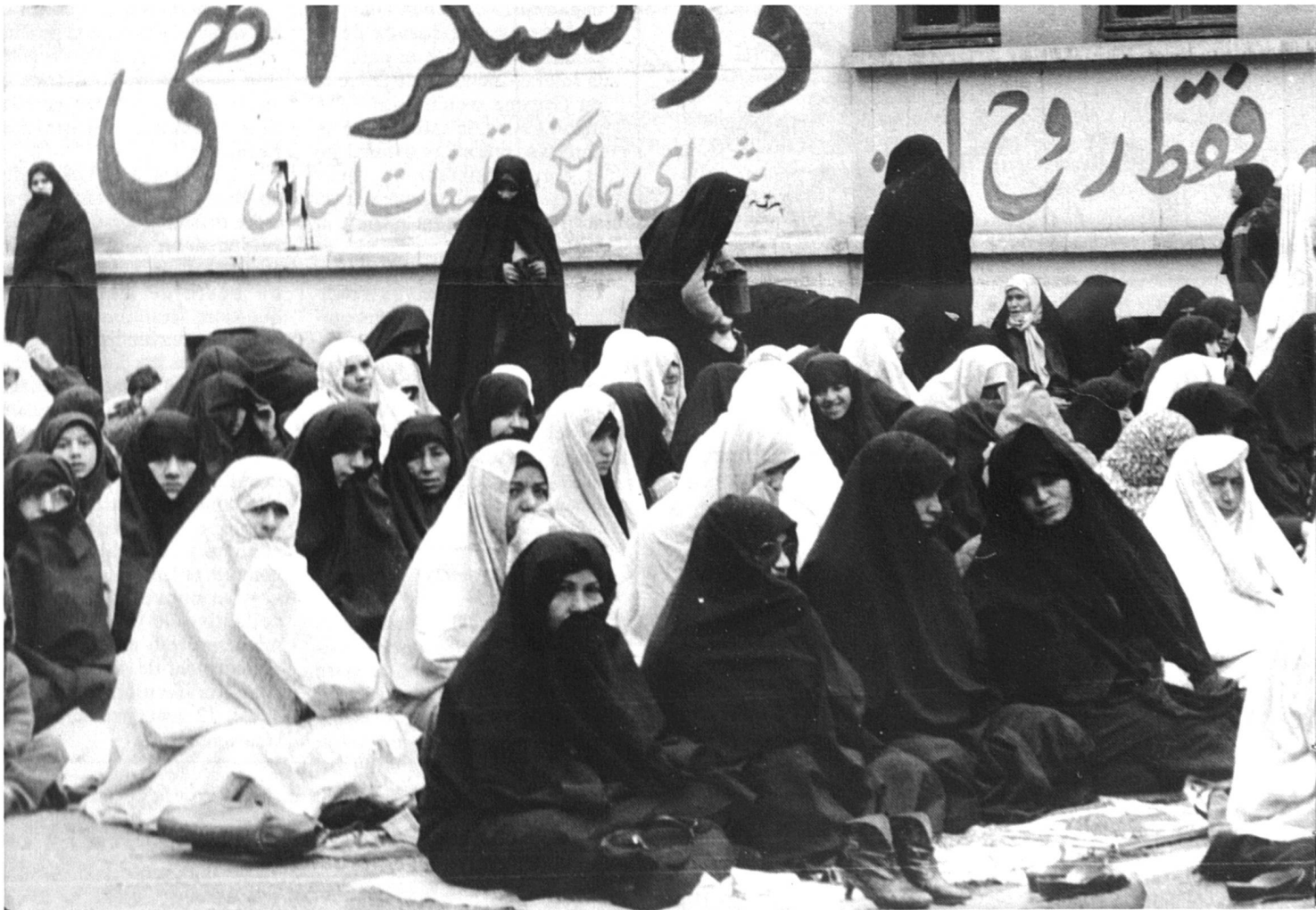
Femmes à la prière à l'Université de Téhéran. L'heure de la grande prière du vendredi, sur fond de slogan révolutionnaire.

Les femmes et l'islam, thème propice à toutes les simplifications de la bonne et de la mauvaise conscience occidentale — de la condamnation dogmatique à la complaisance coupable. Un dossier pour y voir plus clair.