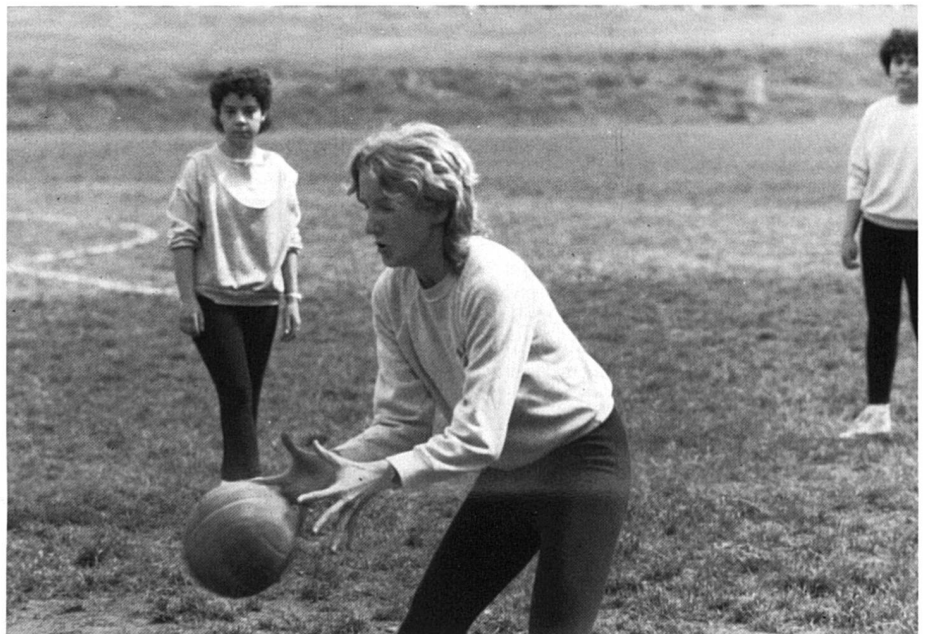
La concurrence des autres activités: par exemple, le sport. (Photo réalisée dans le cadre d'un cours facultatif au CO de Genève)

est une question de milieu social: «Dans certains milieux BCBG, les enfants sont aussi ignares que dans ceux défavorisés