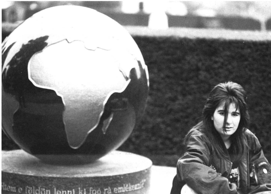
Pour découvrir d'autres mondes. (Photo réalisée dans le cadre d'un cours à option au CO de Genève)

lescent-e-s vont en librairie, flânent entre les rayons et repartent des livres plein les bras. Collégienne, je me souviens qu'avec mon amie, un de nos passe-temps favoris était de rester plantées devant les rayons des librairies à tripoter les livres, lire les quatrième de couverture, les commenter avant d'acheter et ensuite de se prêter les livres dévorés. Le choix était on ne peut plus éclectique, rarement inspiré par l'école ou la nécessité d'étaler notre érudition, mais bien par des enthousiasmes très personnels. Nous lisions à tâtons.