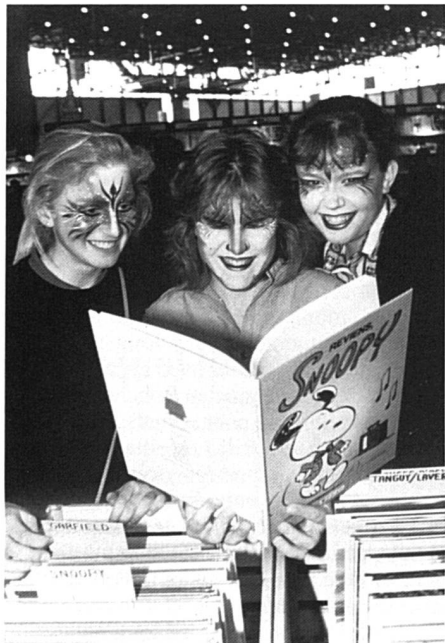
La BD reste un must.

Une petite lacune à relever quant à la forme du questionnaire: nous aurions dû