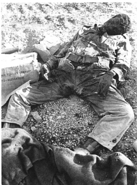
Guerre des Six Jours, juin 1967, dans le Sinaï: «Que de sentiment ma chère!»

Ce à quoi une Tunisienne répondit: «Pour moi aussi la guerre du Golfe a été un révélateur et non seulement du pouvoir absolu de la parole masculine. J'avais oublié le racisme latent, les bases viciées des relations entre l'Europe et ses anciennes