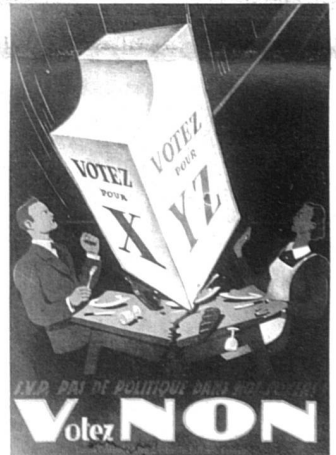
Affiche des adversaires de l'introduction du suffrage féminin sur le plan communal à Neuchâtel, 1941.

Le livre de Lotti Ruckstuhl, ancienne présidente de l'Association suisse pour le suffrage féminin, rend compte de cette histoire trop peu connue.