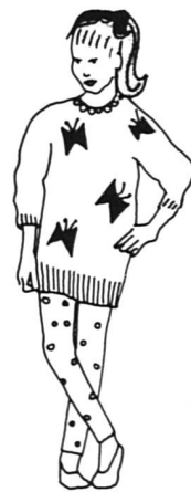
10 ans d'égalité des sexes

Carte du groupe de travail «Frauen öffnen die Schweiz».