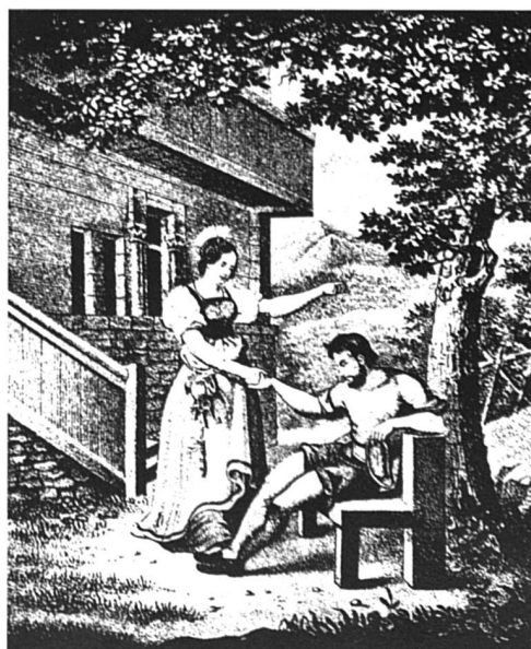
C'est Gertrud Stauffacher qui aurait poussé son mari à aller prêter serment au Grütli.

Mais là n'est pas le problème. Est-ce que moi, citoyenne suisse de 1991, je me sens concernée par ce 700 e ?