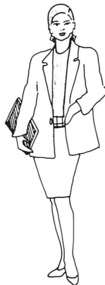
20 ans de suffrage féminin