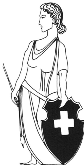
700 ans de la Confédération