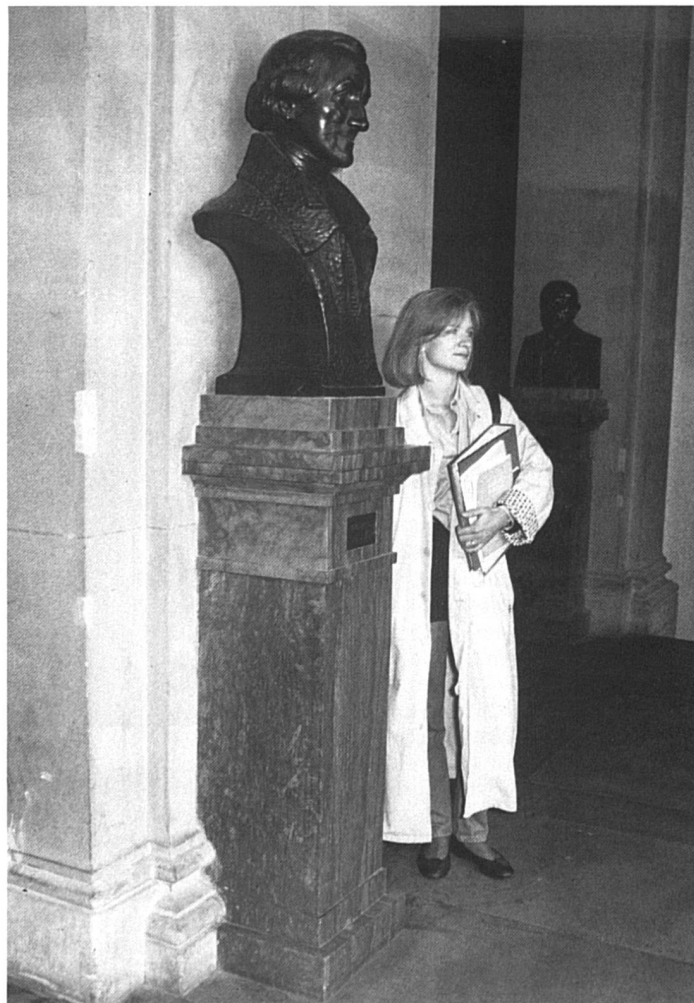
Le mariage aura-t-il finalement lieu entre la Suisse des «hommes en place» et celle des femmes en mouvement?