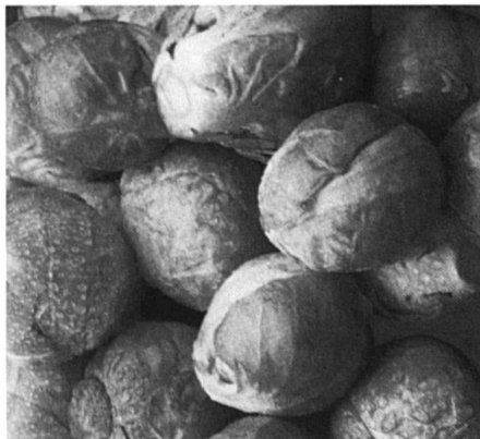
Bien que détaillé concernant l'être humain, le projet reste imprécis au sujet de l'utilisation du patrimoine génétique des plantes et des animaux.

Le peuple est invité à se prononcer sur l'application des techniques de reproduction et de manipulation génétique. C'est une question fondamentale qui est ainsi posée aux citoyennes et citoyens de notre pays. Certain-e-s défendent le droit des femmes stériles à un traitement de leur choix, d'autres craignent les abus qui conduiraient dans le pire des cas à la fabrication d'êtres humains «artificiels». Certain-e-s se demandent si