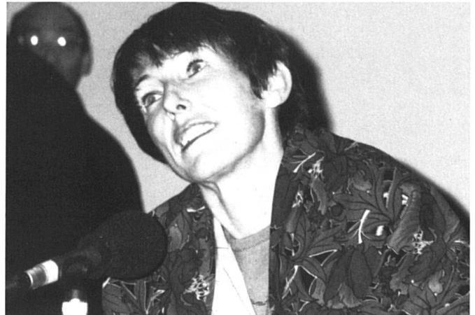
Michèle Le Doeuff: «Vouloir le bonheur, ce serait désuet».

Et puisque j'en suis aux procès et aux regrets, je mentionne encore qu'il m'a semblé dommage qu'un colloque sur les nouvelles formes de l'antiféminisme contemporain privilégie de façon aussi massive le rôle de la morale face à celui du droit. Dans ce domaine, deux exposés étaient prévus, un seul a été lu, l'orateur censé traiter des «fantasmes d'un monde sans sexe en droit» n'ayant pu être présent.