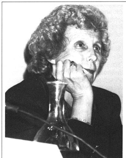
Elisabeth de Fontenay: «Nous avons invité celles et ceux qui croient encore aux droits de la personne humaine.»