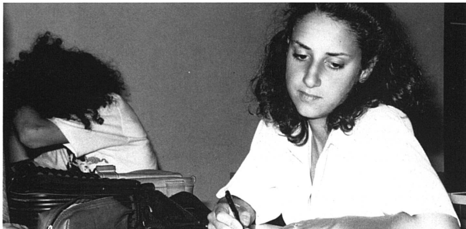
Combien de femmes achèvent leurs études? Combien en retrouve-t-on en activité dans l'industrie?

Beaucoup doit se faire au niveau des cantons. Celui de Genève a adopté une loi qui oblige l'université à fixer tous les quatre ans la proportion de femmes à atteindre pendant cette période. «La seule