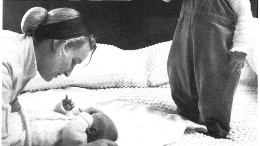
Il devient urgent d'adapter les structures de travail aux conditions de vie spécifiques des femmes.

*** Verein Feministische Wissenschaft Schweiz & FrauenForum Naturwissenschaften, Im Widerstreit mit der Objektivität , Zurich, eFeF-Verlag, 1991, 160 p.