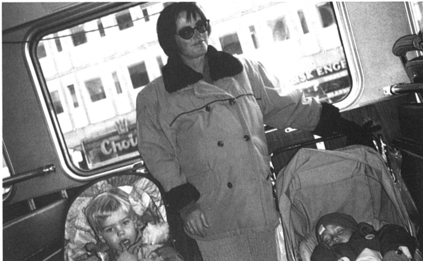
Dans les bus, des espaces réservés aux poussettes.

Les Suédoises disposent encore d'une indépendance financière enviable, liée à la sécurité de l'emploi, et à la force des syndicats; 60% des femmes ont un emploi financé par le secteur public, alors que 75% des hommes travaillent dans le secteur privé. Il est clair que se seront les femmes qui seront les premières à souffrir des compressions budgétaires annoncées pour 1992. Les hommes sont déjà touchés par l'augmentation du chômage.