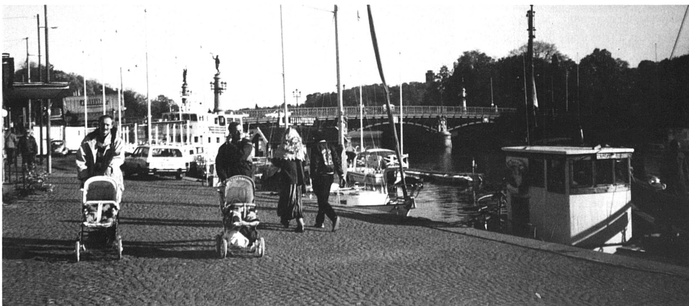
Le congé parental: aussi l'affaire des pères.

En 1990, les femmes suédoises ont battu le record de fertilité des femmes nordiques, se retrouvant à côté des Irlandaises, avec 2,14 enfants par femme (enfants désirés, car l'avortement est autorisé pendant les quatre premiers mois de grossesse). La presse a beaucoup commenté ce record, qui était déjà bien visible dans les rues où les poussettes abondent. Les démographes y voient l'effet combiné de plusieurs facteurs. D'abord les femmes ont retardé leur première maternité jusqu'au moment où elles et/ou leur partenaire ont gagné un salaire qu'ils estiment confortable. Les Suédoises ont aussi le record d'âge pour la première maternité: 27 ans. Ensuite, la peur d'avoir plus de difficultés à concevoir une fois la trentaine entamée les a fait se presser pour compléter la famille. Enfin, il y a les avantages sociaux. En enchaînant les naissances de deux ou même trois enfants à environ deux ans d'intervalle, les congés de grossesse puis de parent se suivent et la famille dispose de revenus convenables et d'un parent à la maison. Si les enfants avaient été plus espacés, le parent à la maison aurait dû reprendre son travail, très