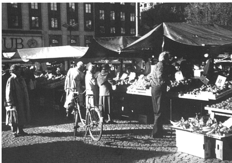
Une retraite digne, l'occasion de profiter pleinement de la vie.