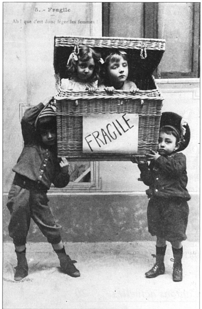
Ah! que c'est donc léger les femmes! «Fragile», N° 5 d'une série de cartes postales du début du siècle. (Bibliothèque Marguerite-Durand, ville de Paris).

Même au niveau de l'image, les actes manqués existent. Une femme pour remplacer René Felber, mais laquelle? se demandait 24 Heures dans son édition du 6 mars dernier. Or, en observant attentivement la silhouette en blanc sur l'image, pas de doute, la femme que ces messieurs pourraient envisager aux côtés des autres conseillers fédéraux doit bel et bien entrer dans un moule tout conçu, un moule d'homme.