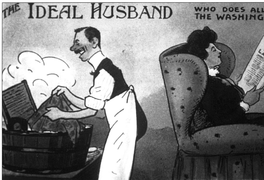
«Le mari idéal fait toute la lessive.» Au début du siècle, les suffragettes anglaises prêchaient déjà, à leur manière, le partage des tâches!

l'esclave de traditions familiales démodées, formant un frein à l'application de l'égalité. Et, je me suis posé la question de mes exigences quant au propre et au rangé... C'est là, je crois, un examen intéressant à faire avec d'autres, car il suscite discussions et réflexions parfois passionnantes et amusantes.