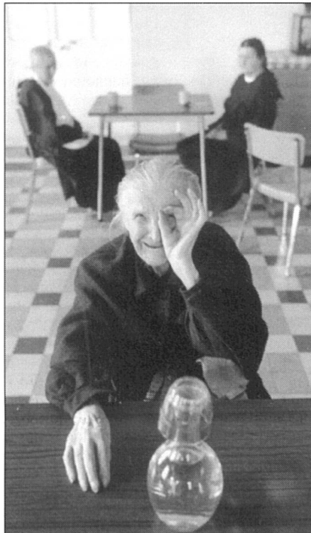
Le nouveau droit du divorce: trop peu, très tard.

Questions revenus, le parcours des femmes divorcées est révélateur. Contrairement à ce qui est généralement admis, le