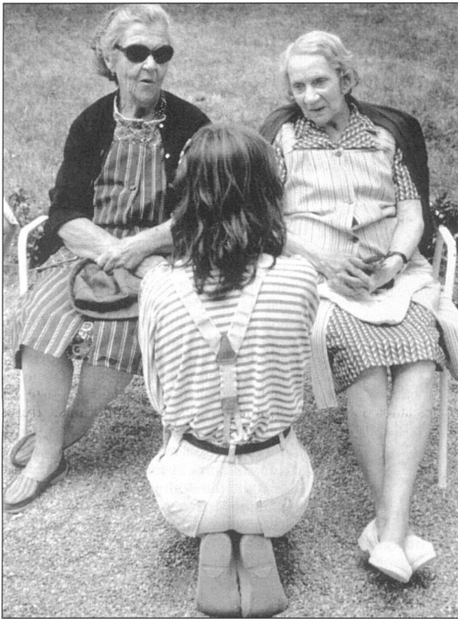
Transmettre un message aux jeunes générations.

Ouverture sur la vie, mémoire de la vie: l'Université du 3 e âge de Neuchâtel connaît un succès grandissant.