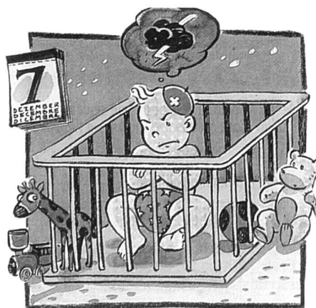
Comité Né le 7 décembre.