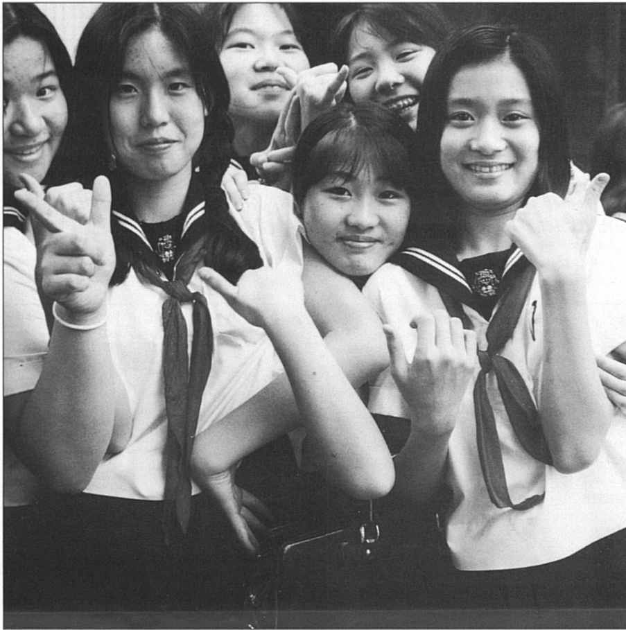
L'uniforme est encore de rigueur pour les collégiennes et les collégiens.

demande quatre ans d'études, les étudiantes ne forment plus que le tiers des effectifs. Il faut signaler que cette proportion est en augmentation constante. Du côté des enseignantes, elles forment le 60% au niveau primaire, 25% au niveau secondaire, près de 40% aux «collèges» de 2 ans et 10% des universités. Là aussi les chiffres progressent de manière positive pour les femmes.