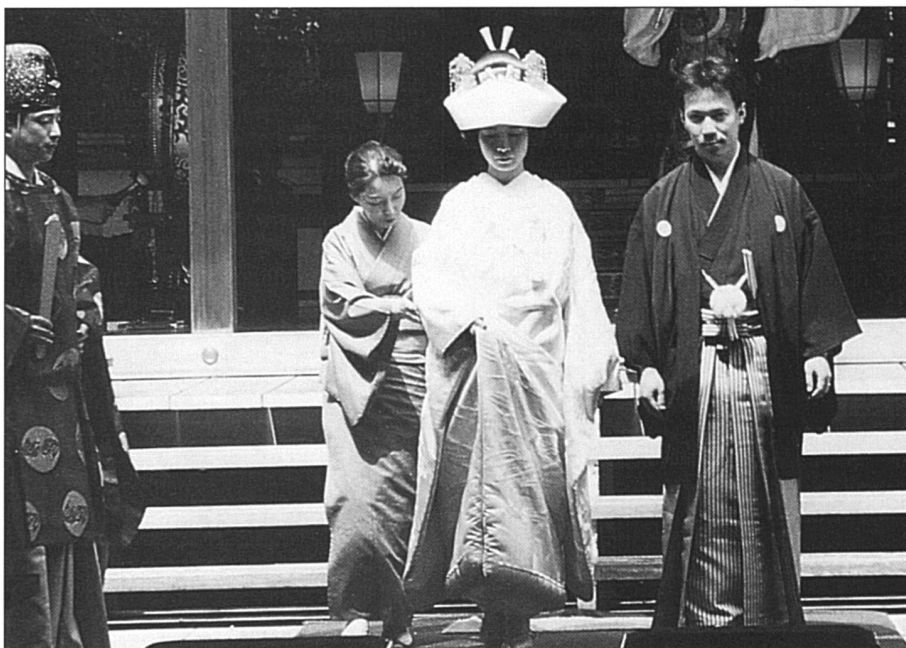
Mariage traditionnel dans un sanctuaire shinto. La pression familiale est intense pour encourager les jeunes femmes à se marier.

Avoir un enfant au Japon est une entreprise onéreuse. L'accouchement n'est pas remboursé par la caisse maladie nationale. Certains employeurs donnent cependant un bonus bébé. Le congé maternité est de 14 semaines, indemnisé à 60%, une fois le crédit des vacances épuisé! Depuis 1991, la loi prévoit la possibilité de demander un congé parental d'un an mais sans indemnité de salaire. En 1995, l'indemnité sera de 25% du salaire. Elle devra être augmentée au cours des années suivantes. La loi encourage aussi les employeurs à proposer des horaires de travail réduits pour les parents qui ne prendraient pas le congé parental ou qui ont un enfant d'âge préscolaire. Quelques rares entreprises profitent d'une nouvelle subvention étatique pour installer des crèches. Les journaux parlent sans cesse de la baisse de la natalité et du vieillissement de la population. Le taux de fertilité est de 1,5 enfant par femme, un des plus bas du monde. Le gouvernement avance lentement vers quelques modifications qui puissent encourager la natalité. Une enquête récente révèle qu'une majorité de parents souhaiteraient un autre enfant mais qu'ils renoncent faute d'argent surtout, à cause du travail de la mère et de l'exiguïté des logements ensuite.