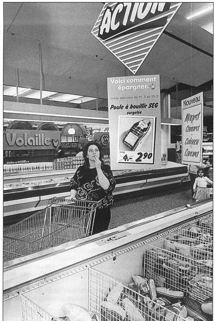
Flâner dans les magasins peut devenir instant de détente et loisirs.