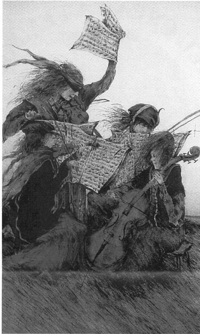
On n'a jamais vu de Beethoven femme! Vraiment?

Version n° 3: enfin, l'homme se raconta des histoires. Nancy Huston fait un petit catalogue des histoires qu'il se raconte, «par exemple, que l'homme ne sort pas de la femme, mais la femme de l'homme. Et Dieu créa la femme. Et de la tête de Zeus jaillit Athéna, armée de pied en cap. Et Héphaïstos fabriqua Pandore. Et Pygmalion donna la vie à Galatée. Et de la côte d'Adam fut tirée Eve» 2 .