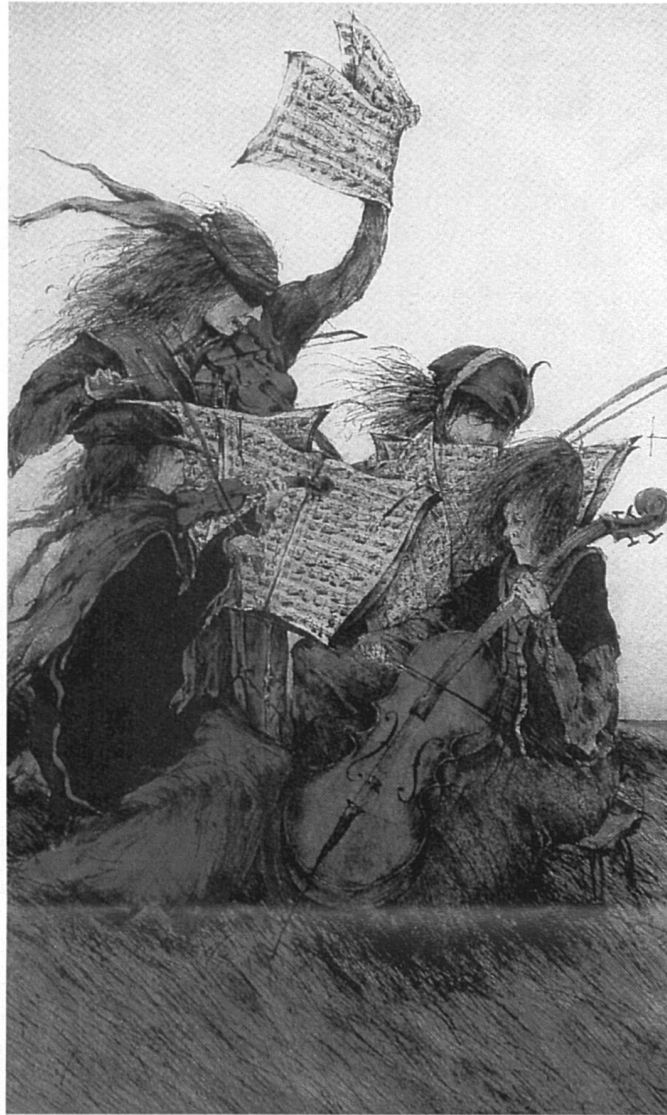
On n'a jamais vu de Beethoven femme! Vraiment?

Version n° 3: enfin, l'homme se raconta des histoires. Nancy Huston fait un petit catalogue des histoires qu'il se raconte, «par exemple, que l'homme ne sort pas de la femme, mais la femme de l'homme. Et Dieu créa la femme. Et de la tête de Zeus jaillit Athéna, armée de pied en cap. Et Héphaïstos fabriqua Pandore. Et Pygmalion donna la vie à Galatée. Et de la côte d'Adam fut tirée Eve» 2 .