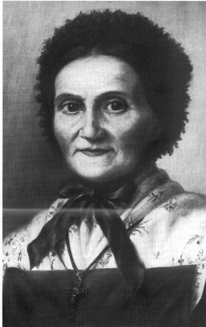
Marguerite (1815-1879) vénérée à la Fille-Dieu depuis plus de 100 ans, béatifiée le 29 octobre dernier à Rome.

Marguerite Bays (1815-1879), qu'on appelait «Goton», est une fille du pays.