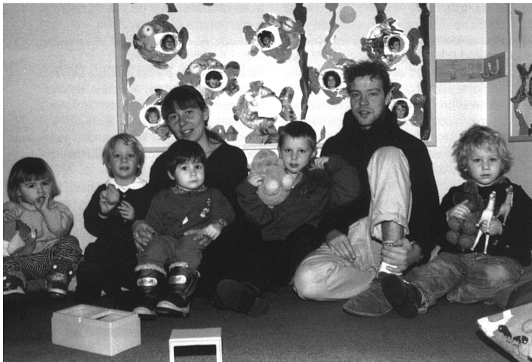
«Educateur, éducatrice de la petite enfance»

Le Québec est à nouveau pionnier dans sa manière d'aborder la problématique, grâce aux deux ouvrages: Garçons et filles, stéréotypes et réussite scolaire 1 , ainsi que Modèles de sexes et rapports à l'école 2 . Les équipes rédactionnelles ont cherché à comprendre et à démonter les mécanismes de cette contradiction, en prenant pour hypothèse de départ le contre-pied de Baudelot et Establet 3 .