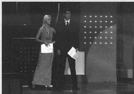
Bingo Show (2003)

Restent encore à découvrir Bingo Show (2003) et A Carp Jumps in his Mind (2005). Le premier révèle les présentateurs/trices du loto télévisé dans l'attente de prendre l'antenne, comme un conte moderne sur les habitant-e-s de la petite lucarne, pantins inanimés qui ne prennent vie que lorsque le tube cathodique s'allume... Dans A Carp Jumps in his Mind , la lecture en voix off d'un manga sur la bombe atomique, Barefoot Gen , se superpose aux images d'un jeune Japonais se promenant dans une forêt proche d'Hiroshima. Le visuel paisible atténue l'horreur du récit, le renouveau d'une nature luxuriante et calme s'oppose à la chronique de destruction, le présent et l'avenir répondent au passé, associant la sérénité à l'indispensable travail de mémoire.