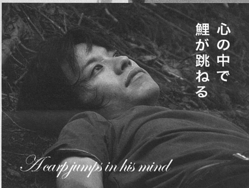
A Carp Jumps in his Mind (2005)

Les œuvres de Christelle Lheureux évoquent ainsi l'expérience humaine contemporaine, les décalages liés aux passages entre nature et urbanisation, aux déplacements culturels et géographiques, à l'aller-retour entre passé et présent, renvoyant peut-être, comme dans L'expérience préhistorique , à la nécessaire déconstruction et reconstruction personnelle qui en découle. Dans tous ses films, on retrouve les préoccupations de la vidéaste : le travail de dissociation entre le son et l'image, entre la voix et le personnage, mêlé à la superposition des textes, se double de liens et de sens parallèles permettant de créer de nouveaux narratifs. Le/la spectateur/trice peut laisser son imaginaire vagabonder et construire sa propre interprétation. Une expérience inédite et l'opportunité d'appréhender le cinéma et le réel autrement.