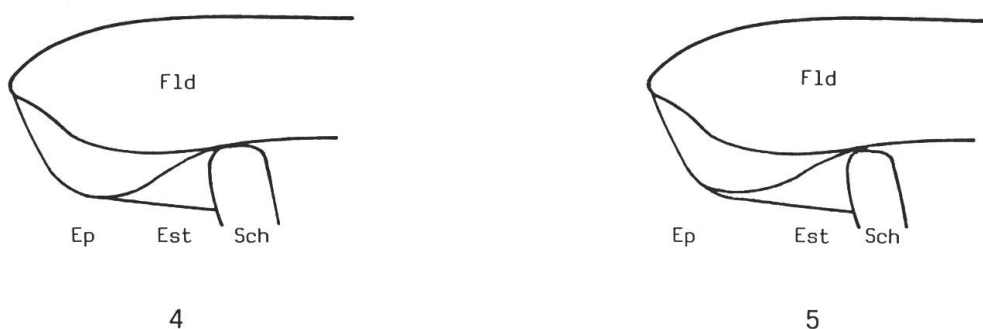
Abb. 4–5: Metathorax (oben, links) von: 4, Otho himalayensis n.sp., 5, Otho opacus n.sp. Fld = Flügeldecken, Ep = Epipleuren, Est = Episternen, Sch = Schenkeldecken.

Halsschild quer (L:B = 1:1,25), kugelig gewölbt, ohne beulenförmige Erhebungen, die vollständigen, schmalen Seitenrandkanten von oben nicht gleichzeitig sichtbar, die gewölbten Seiten nach vorn so gerundet, daß sie im Verlauf mit dem konvexen Halsschildvorderrand einen nahezu halbkreisförmigen Bogen bilden, vor den ungekielten Hinterwinkeln sanft eingebuchtet, mit vollständiger, nur gering ausgeprägter, zum Vorderrand verlöschender Mittelfurche, beiderseits der Halsschildmitte mit einem unscharf begrenzten, rundlichen, seichten Grübchen. Basis doppelbuchtig, links und rechts neben der Medianfurche mit einer kleinen, schwachen Impression, an deren Innenrand sich vor den