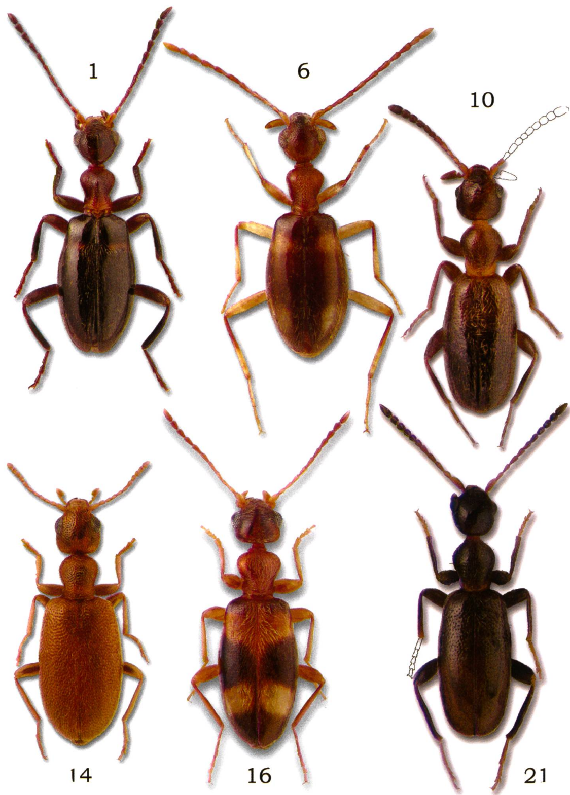
Habitus Tafel. 1, Pseudoleptaleus dromedarioides sp.nov. (H). 6, Pseudoleptaleus sichuanus sp.nov. (P). 10, Anthicus monstrator sp.nov. (H). 14, Anthicus panayensis sp.nov. (P). 16, Stricticollis sternbergi sp.nov. (H). 21, Anthicus vicarius sp.nov. (H). (Holotypus = H, Paratypus = P.)