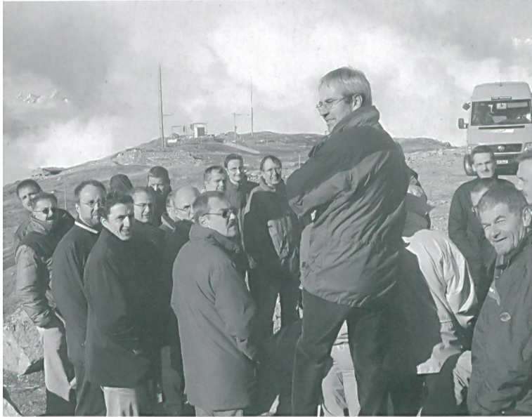
Die Energiefachstellenkonferenz tagt jährlich zwei Mal, einmal in Bern und einmal bei einem Kanton. An der letzten Sitzung besichtigten rund drei Dutzend Teilnehmer am 12. September die Windanlage Gütsch bei Andermatt.

Förderprogramme. Laut den Artikeln 13 und 15 des Energiegesetzes sollen die Kantone die Globalbeiträge für Massnahmen zur sparsamen und rationellen Energienutzung sowie zur Nutzung erneuerbarer Energien und von Abwärme einsetzen. 2003 schüttete der Bund 14 Mio. Franken (Vorjahr: 13 Mio. Fr.) an Globalbeiträgen aus, und zwar an die Kantone mit eigener Energiegesetzgebung, einem kantonalen Förderprogramm und entsprechendem Kredit. Auf einen Franken Bundesbeitrag legen die Kantone dabei noch an die vier eigene drauf (43,2 Mio. Fr.). Insgesamt stehen den Kantonen für energetische Fördermassnahmen im Jahr 2003 Fr. 7.74 pro Einwohner zur Verfügung.